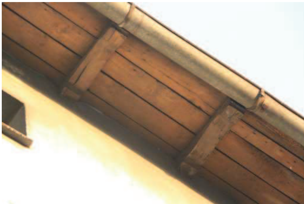
Ryc 3. Ubytki i potencjalne siedliska na styku dachu i ściany 2