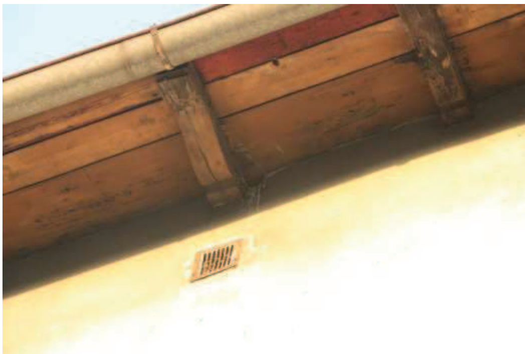
Ryc 2. Ubytki i potencjalne siedliska na styku dachu i ściany 1

Dla nietoperzy atrakcyjne są ubytki w tynku na wszystkich ścianach budynku, szpary pod parapetami i pod opierzeniem. Na strychu mogą okresowo pojawić się wyłącznie pojedyncze nietoperze.