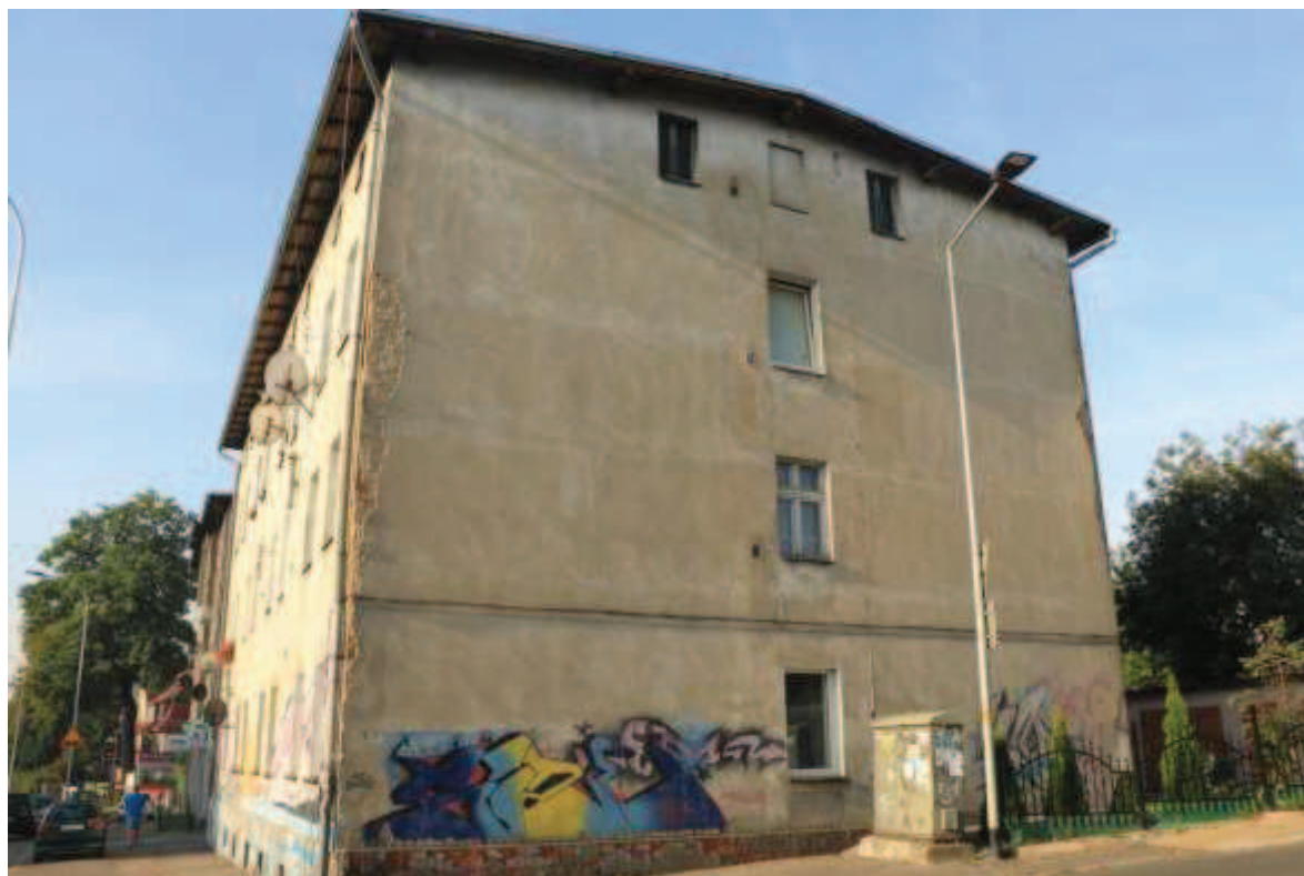
Ryc 1. Budynek – przedmiot analizy