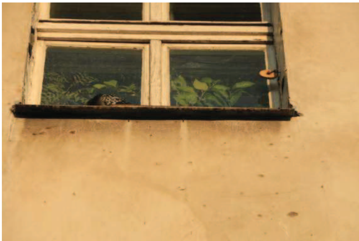
Ryc 6. Potencjalne siedlisko pod parapetem