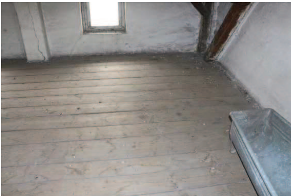
Ryc 5. Użytkowany fragment poddasza