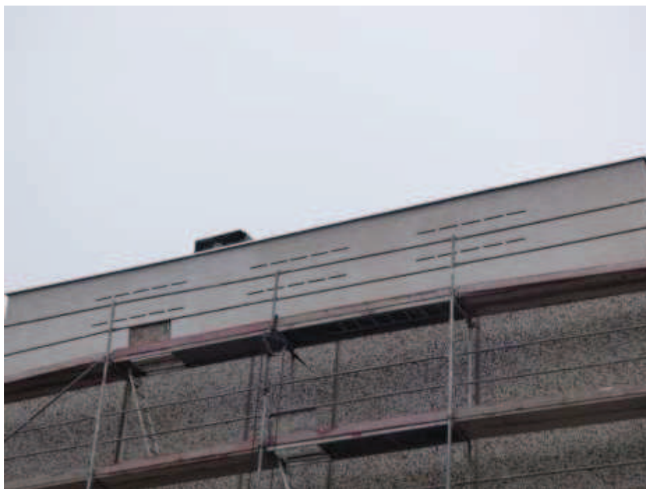
Ryc 7. Budki podtynkowe dla nietoperzy – przykład ściany bloku z 30 dużymi budkami dla nietoperzy. W analizowanym budynku zaleca się montaż 2 tego typu budek.

Likwidacja potencjalnych siedlisk nie wymaga zgody RDOŚ.