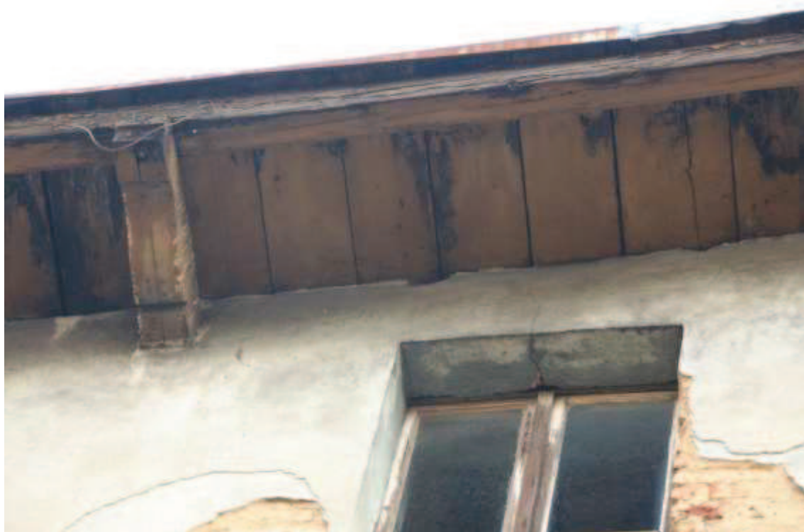
Ryc 4. Ubytki i potencjalne siedliska na styku dachu i ściany 3